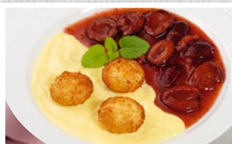
Zwetschgenknödel mit Vanillesoße, dazu fruchtiges Pflaumen- kompott (mit Zucker(n) und Süßungsmittel)

Weitere Informationen zu unseren Weihnachts- Menüs finden Sie auf der Rückseite.