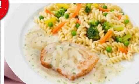
Zarte Hähnchenbrust in einer cremigen Zwiebelsoße mit Gemüse-Nudeln